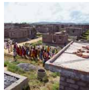
1.150 Häuser für die Familien der Kalköfen-Arbeiter entstehen hier gerade mithilfe der Regierung. Für 750 Häuser gibt wortundtat den Familien einen Zuschuss.