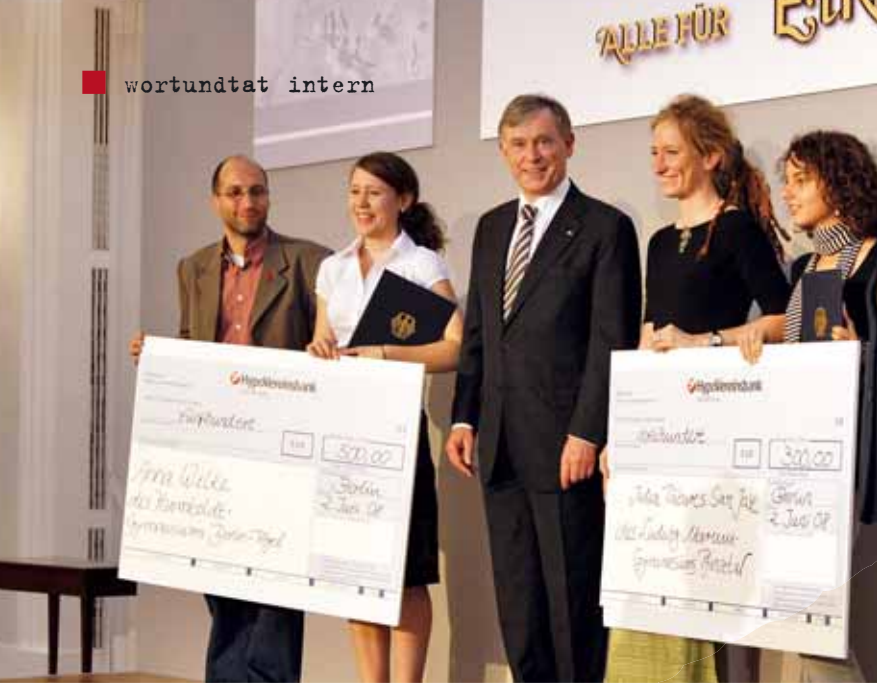
2008 überreichte Bundespräsident Horst Köhler den Gewinnern des Schulwettbewerbs „Eine Welt für alle“ die Preise. Jetzt geht eine neue Staffel los – unterstützt von wortundtat.