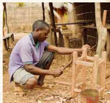
Der Dorf-Schreiner baut mit einfachsten Mitteln einen Stuhl.

E in schmaler Weg führt vorbei an kargen Maisfeldern, in denen vereinzelt Cashew-Bäume wachsen. Dann versperrt manns-hohes Elefantengras den Blick auf die Anbau-flächen. Der Geruch von Rauch steigt in die Nase, untrügliches Zeichen dafür, dass sich der Reisende einer Siedlung nähert. Der Weg öffnet sich, und auf einer großen Fläche stehen grasge-deckte Lehmhütten, dazwischen Kokospalmen.